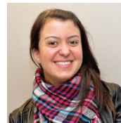
Colaboração: Rachel Buzzoni

Com os dados em mãos é possível você conferir diversas informações atualizadas no novo site de RI e desfrutar de conteúdos exclusivos. Aproveite e navegue também no site do nosso clube e também em nossa página no Facebook.