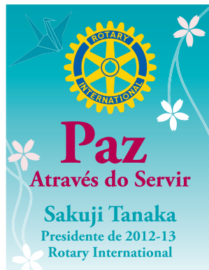
Logo Gestão 2012-13