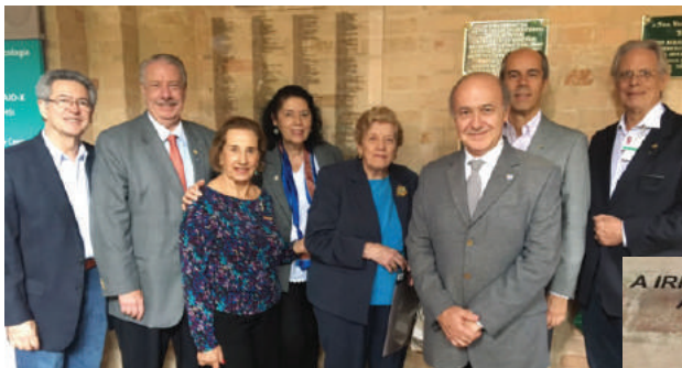
Homenagem da Santa Casa de São Paulo ao RCSP Pacaembu por todas as doações recebidas.