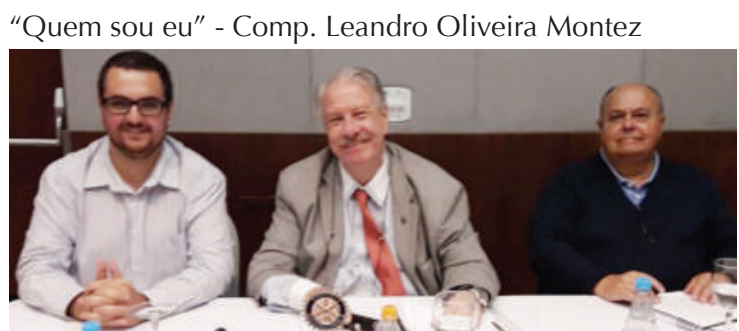
“Quem sou eu” - Comp. Leandro Oliveira Montez