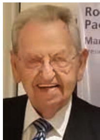
24/02 - comp. Edmondo