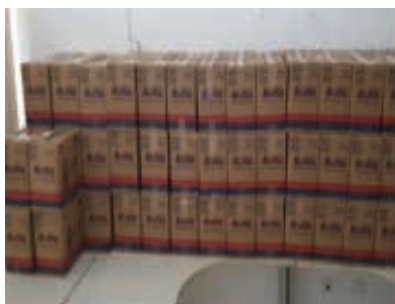
SASF Bela Vista