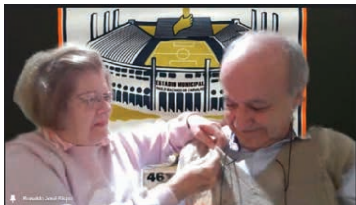
Companheiro Bispo recebeu sua 3ª e 4ª safiras Paul Harris.