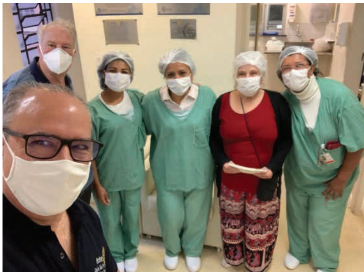
Aproveitamos a ida à Santa Casa e visitamos o Banco de Leite Humano