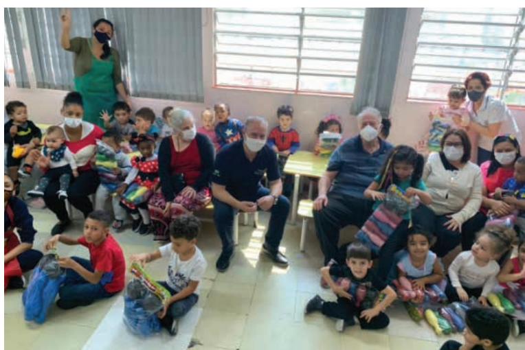
Ação de Dia das Crianças na Creche da Santa Casa