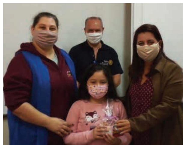
Ação de Dia das Crianças na Escola Estadual Pedro II