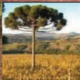
(como as mudas de Araucária ficarão)