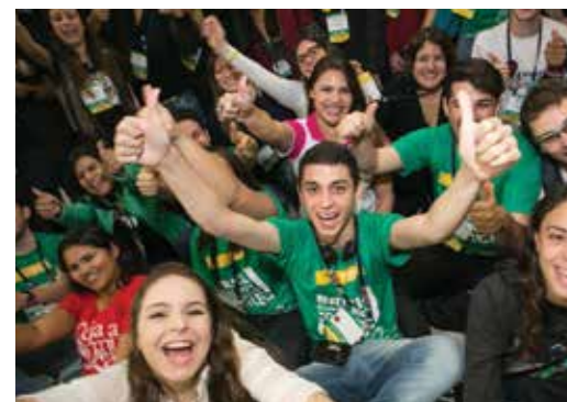
Rotaractianos têm um encontro anual logo antes da Convenção do Rotary.

Acreditamos em investir no nosso futuro, capacitando jovens líderes, ajudando-os a aprender habilidades de liderança e dando-lhes a oportunidade de ter experiências interculturais.