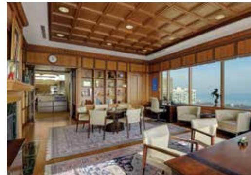
Escritório do presidente do RI, no 18º andar do prédio One Rotary Center, com vista ao Lago Michigan.

Os representantes de Suporte a Clubes e Distritos (CDS) oferecem orientação e respondem a perguntas que você ou os líderes do seu clube possam ter. Eles também participam de algumas reuniões de clubes e distritos para se reunirem com rotarianos e darem treinamento. Encontre o representante CDS do seu clube em rotary.org/cds . Envie perguntas sobre o Rotary para supportcenter@rotary.org .