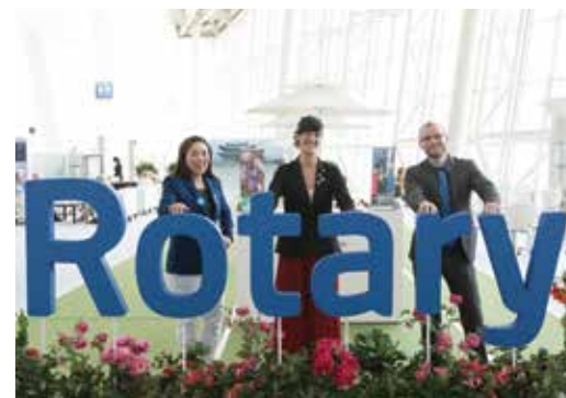
Participantes da Convenção de 2016 na Coreia do Sul.

A primeira Convenção do Rotary foi em Chicago, em agosto de 1910.