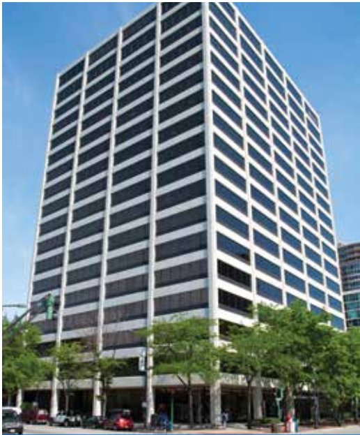
One Rotary Center em Evanston, EUA.

O Rotary International é administrado pela Secretaria, que compreende o secretário-geral e cerca de 800 funcionários que trabalham para apoiar clubes e distritos de todo o mundo. A Sede Mundial do Rotary fica em Evanston, EUA, em um edifício chamado One Rotary Center, que inclui um auditório de 190 lugares, arquivos e um conjunto executivo com salas de conferências para o Conselho Diretor do RI e Conselho de Curadores da Fundação Rotária, além